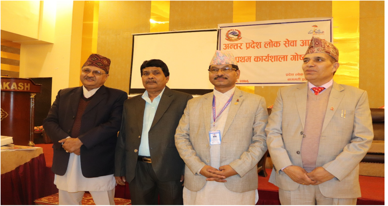
प्रदेश लोक सेवा आयोग प्रदेश नं. १, प्रदेश नं. २, बागमती प्रदेश र प्रदेश नं. ५ का अध्यक्षज्यूहरू