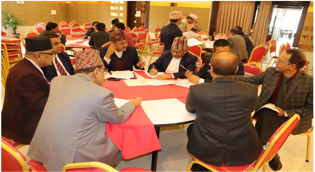
सहभागी आयोगका पदाधिकारी तथा कर्मचारीहरू छलफलमा