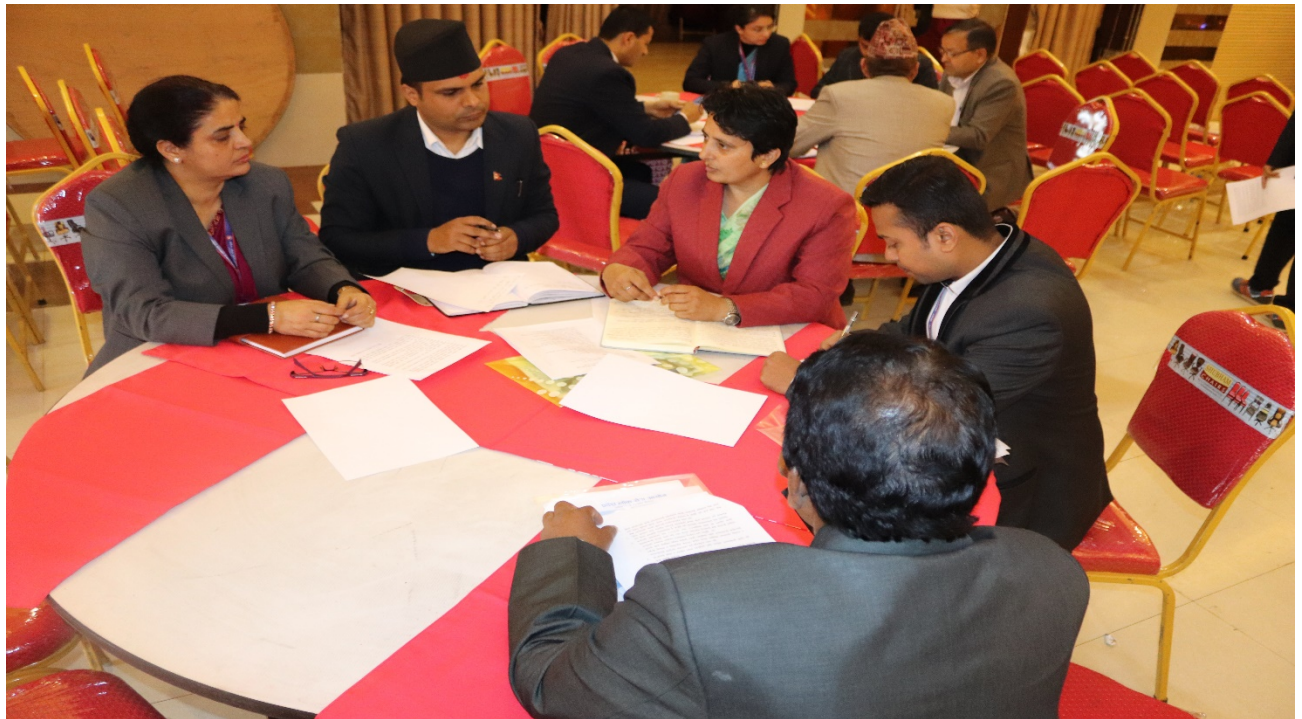
सहभागी आयोगका पदाधिकारी तथा कर्मचारीहरू छलफलमा