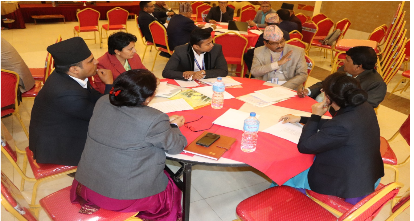
सहभागी आयोगका पदाधिकारी तथा कर्मचारीहरू छलफलमा