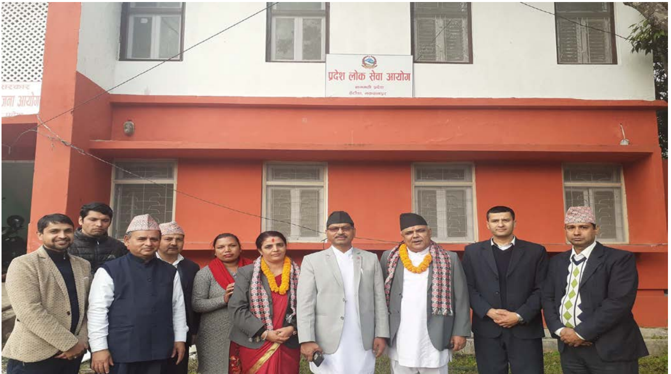
आयोगका अध्यक्ष र सदस्यहरू कार्यालयका कर्मचारीहरूसँग आयोगको परिसरमा