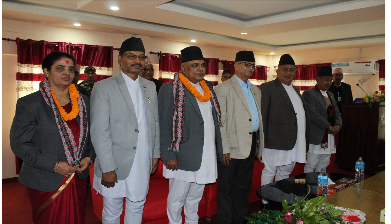
आयोगका अध्यक्ष र सदस्यहरू शपथ ग्रहण पछि माननीय प्रदेश प्रमुख, माननीय मुख्यमन्त्री र बागमती प्रदेशका माननीय सभामुखसँग