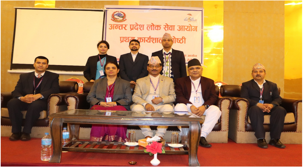
कार्यक्रम समापन पश्चात् बागमती प्रदेश लोक सेवा आयोगका पदाधिकारी तथा कर्मचारीहरू