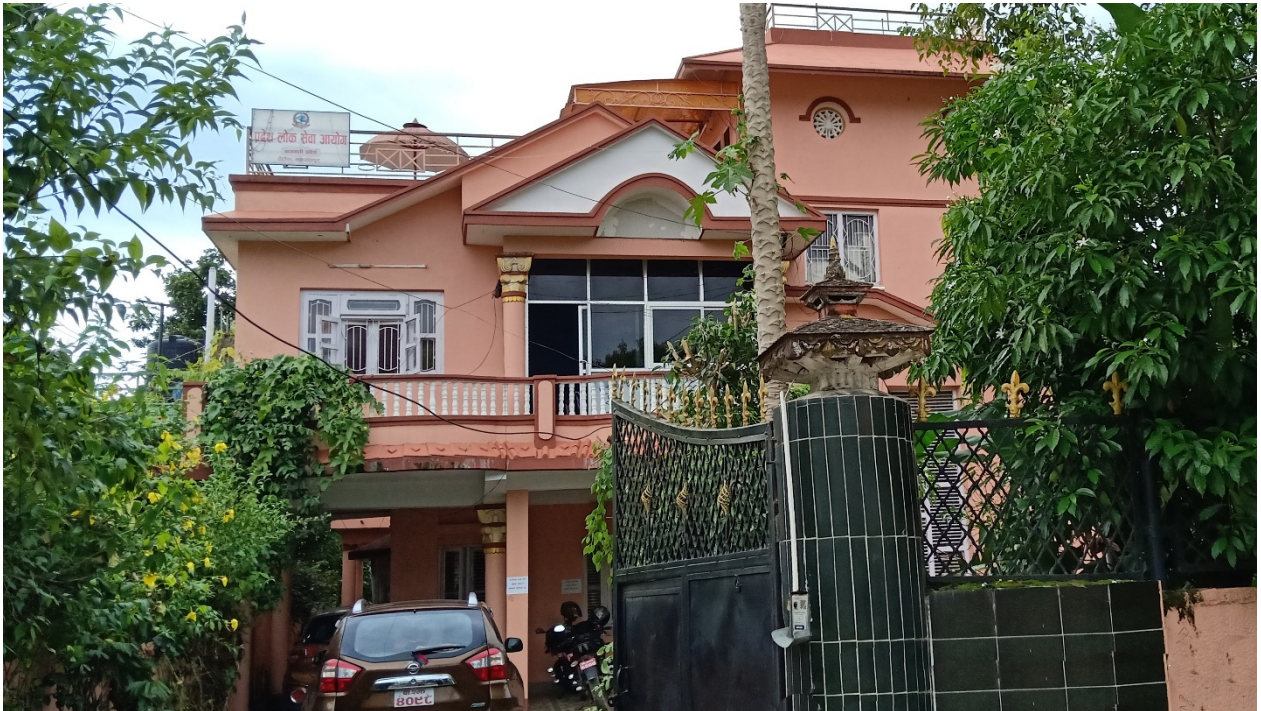
भाडामा रहेको आयोगको कार्यालय भवन